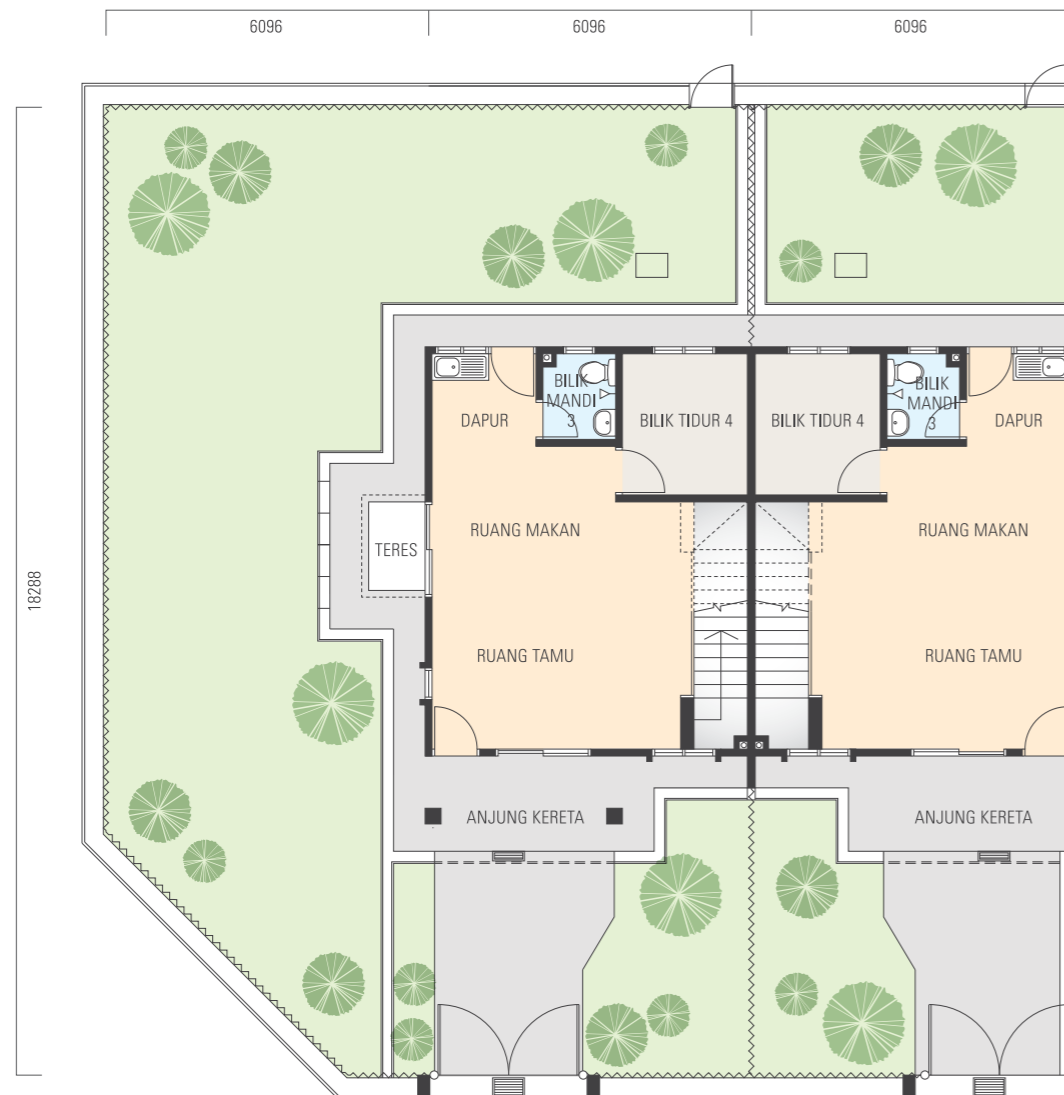
PELAN LANTAI BAWAH